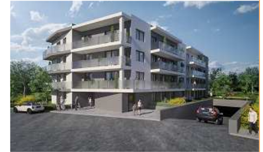
Budynek przy ulicy Budowlanych w Górze Kalwarii