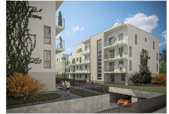
TEDEX RESIDENCE ETAP V Osiedle przy ul. Nowej 17 w Starej Iwicznej