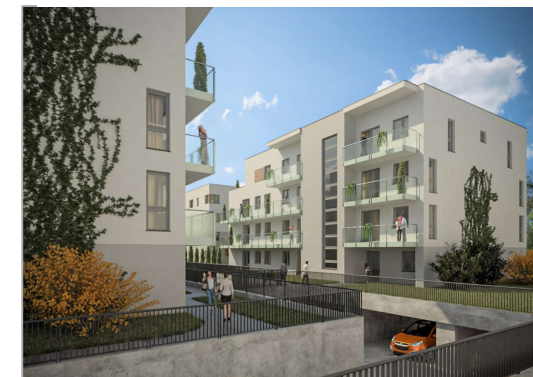
TEDEX RESIDENCE ETAP V Osiedle przy ul. Nowej 17 w Starej Iwicznej