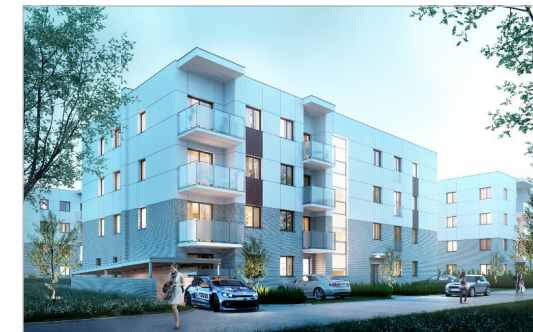
TEDEX RESIDENCE ETAP IV Osiedle przy ul. Nowej 17 w Starej Iwicznej